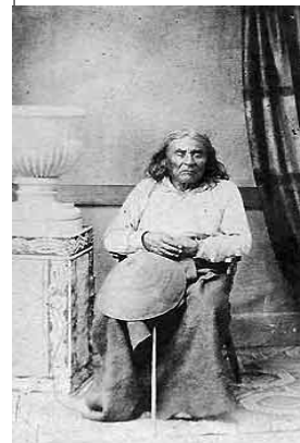
Jefe Seattle, retrato de estudio. -- Photo : Sammis, 1864.