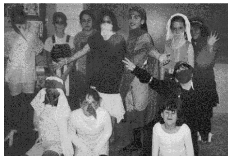
Extraescolar de teatre.